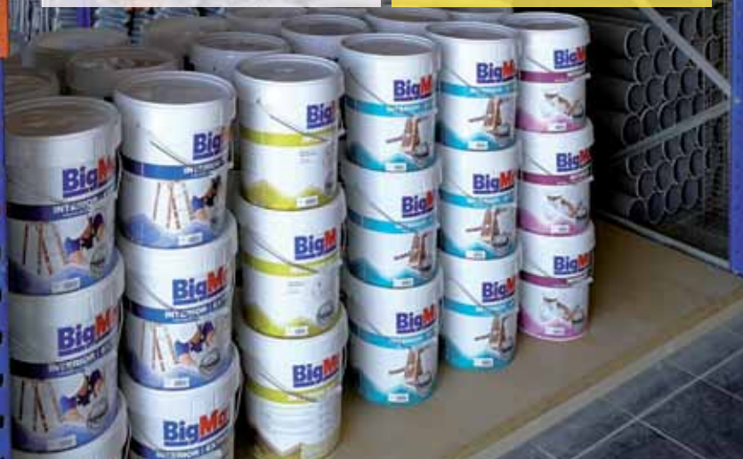
Los tonos mostrados en este folleto no tiene que corresponder exactamente con los colores del fabricante.

También tenemos todas las herramientas que requiere un profesional de la fachada y la impermeabilización.